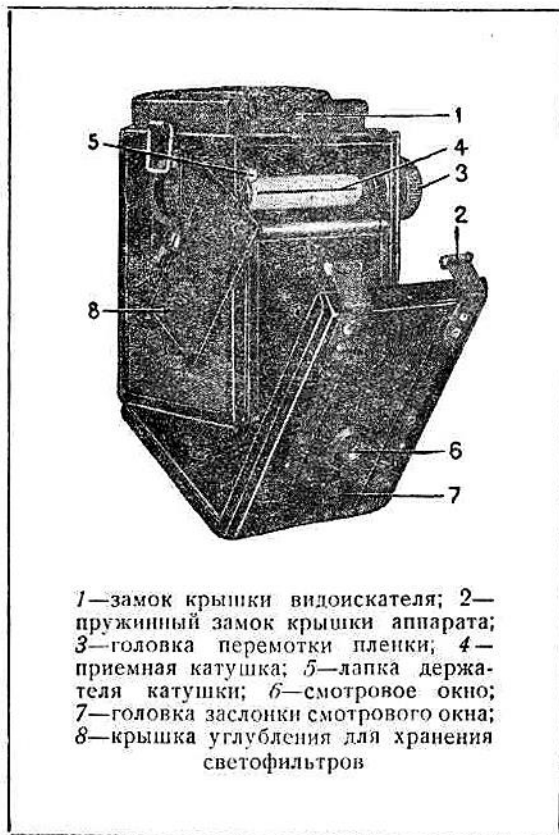
1—замок крышки видоискателя; 2—пружинный замок крышки аппарата; 3—головка перемотки пленки; 4—приемная катушка; 5—лапка держателя катушки; 6—смотровое окно; 7—головка заслонки смотрового окна; 8—крышка углубления для хранения светофильтров

1. Установить объектив на фокус по резкости изображения на матовом кружке или по шкале расстояний.